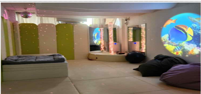
광주 시범사업 복지관 심신안정실 모습