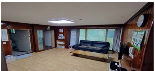
광주 시범사업 지원주택 모습

② (주간 개별 지원) 장애인복지관 등 지역사회 인프라에 시설 보강과 전문인력을 지원하여 개인별 맞춤형 낮 활동 서비스 제공(500명)